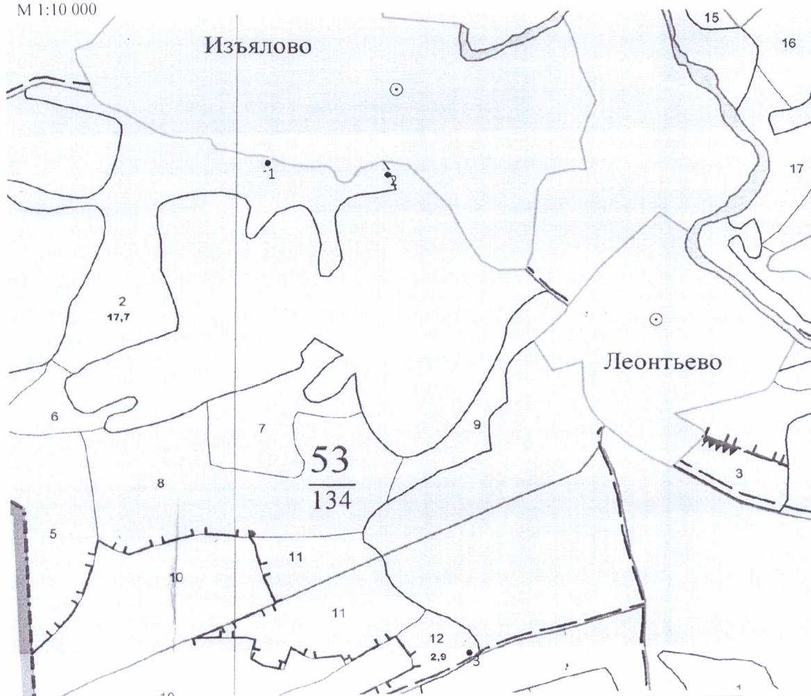
Ленты (круговой площадки) перечёта