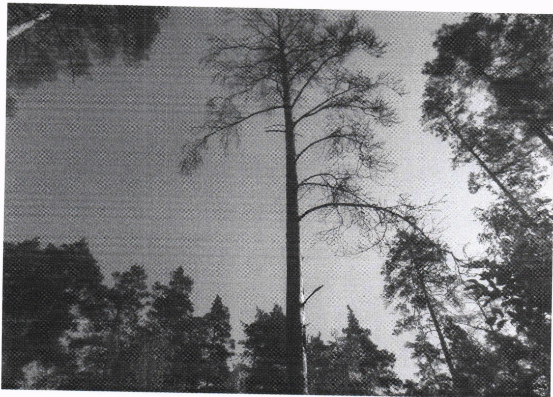
Фотоматериал аварийных деревьев Ильинское участковое лесничество кв 18 выд 18