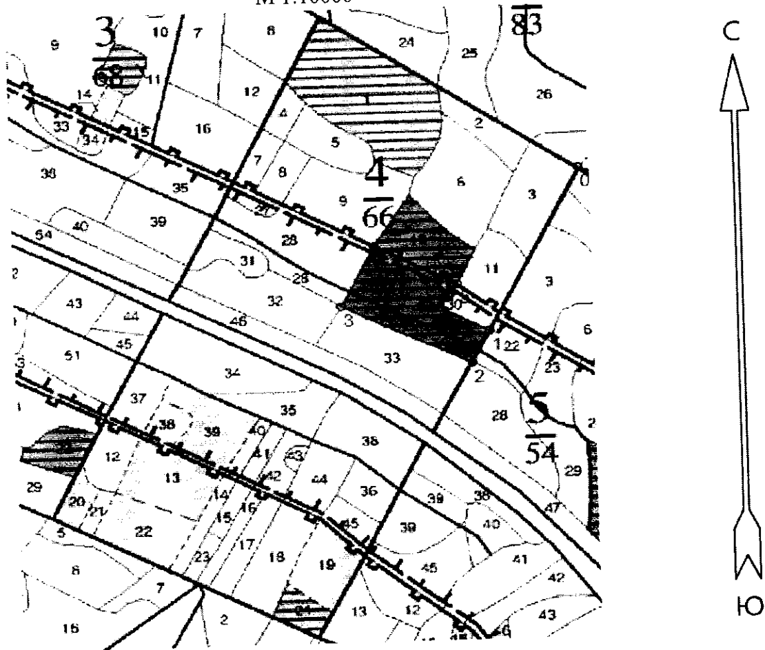
Абрис участка М 1:10000