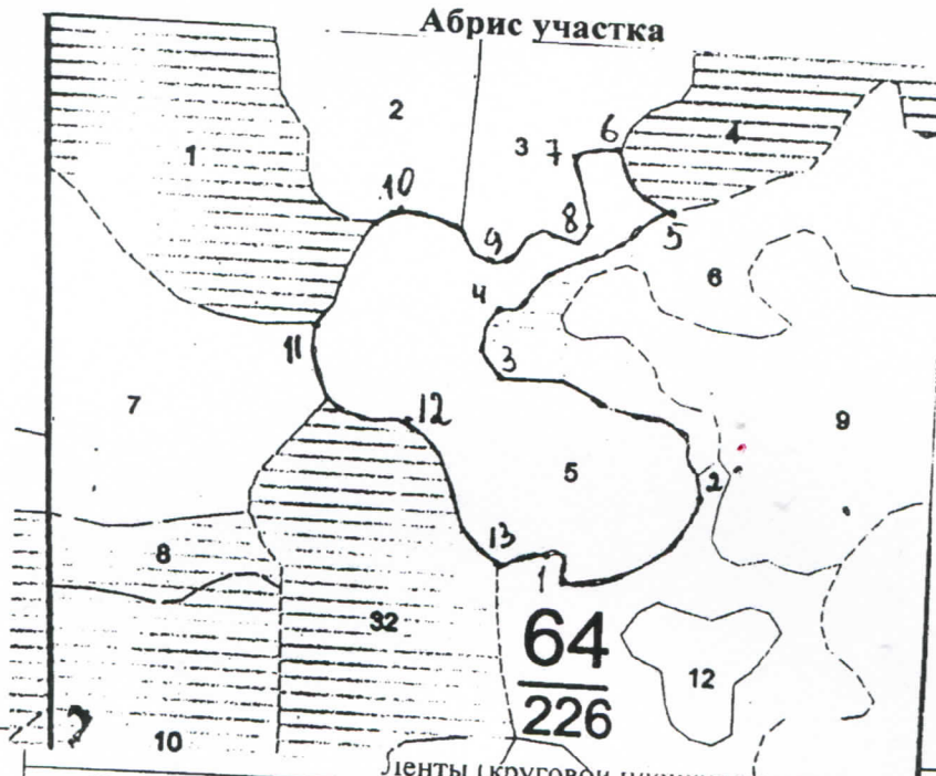
Ленты (круговой площадки) перечета